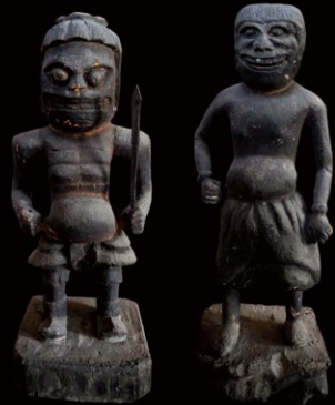
初公開 水辺の守り神