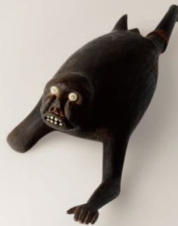
境界を行き来する、変身獣