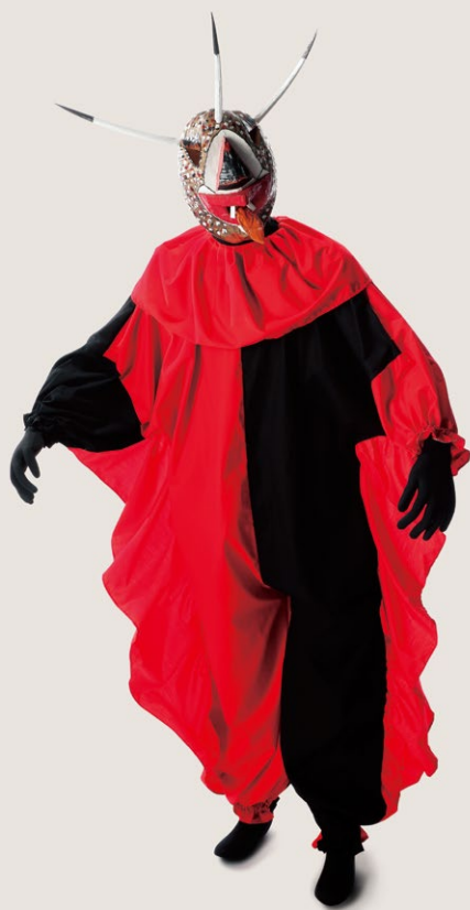
人のようでない、有角人

世界の人々は常識や慣習から逸脱した「異」なるものを、どのように認識し、説明し、描いてきたのでしょうか。本展は、人魚や龍、河童など、想像界の生きもの多様性について、絵画や書籍、祭具などをとおして紹介し、人間の想像と創造の力の源泉を探ります。奇妙で怪しい、不気味だけどかわいい、世界の霊獣・幻獣・怪獣が大集合！