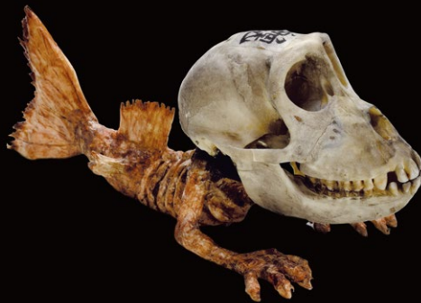
日本最大級の妖怪コレクションの逸品