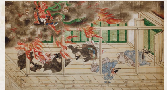
↑ 天満宮御縁起 下巻(部分)

福岡県豊前市と築上郡築上町にまたがる求菩提山に伝わる天狗像。天狗坐像は鼻が高く羽団扇を持って空中を飛行する大天狗、木造八天狗像は鳥のような嘴をもったカラス天狗(小天狗)の姿をしている。求菩提山の天狗は「次郎坊天狗」と呼ばれ、火災を防ぐ火伏せの神として信仰を集めた。