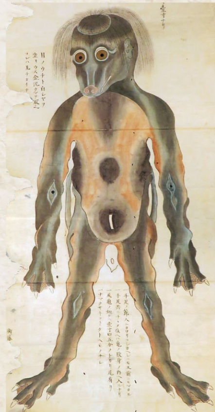
↑ 豊後国肥田川童図 個人蔵

日本各地の産物などを図解した江戸時代中期の書籍。「豊後河太郎」では、大分県の川辺で相撲を取る河太郎(河童)たちと、それを見物する河太郎が描かれている。その姿は全身が毛で覆われ、頭頂には皿のようなものがみえる。