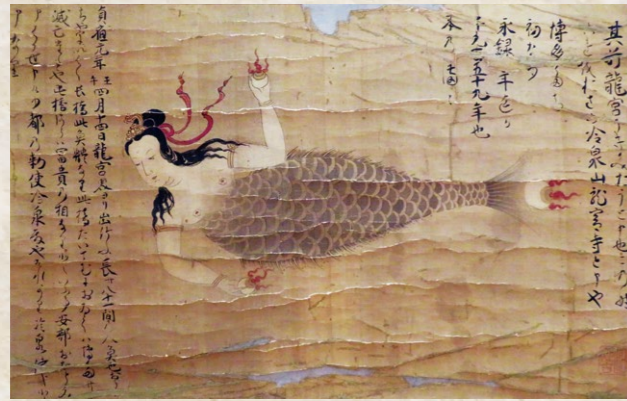
↑ 人魚の掛け軸 龍宮寺蔵

龍宮寺(福岡市博多区)に伝わる人魚の掛け軸。伝承によると貞応元(1222)年、博多湾に打ち上げられ、龍宮寺(当時は浮御堂と呼ばれる)に葬られた。かつては縁日の日に同寺に安置されている「人魚の骨」を浸けた水を、延命長寿を願う参拝者に飲ませていたという。