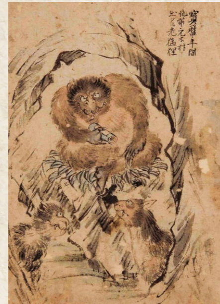
↑ 筑前国宗像郡化物退治図絵