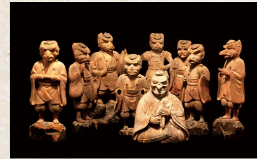
↑ 木造天狗坐像・木造八天狗像