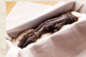
← 牛鬼の手 観音寺蔵

延宝2(1680)年から貞享元(1684)年に筑前国宗像郡本木村(現福岡県福津市)で起こった化物騒動を題材にした絵物語。化物が大勢で本木村を襲い、村人を悩ませていた。最終的には福岡藩三代藩主黒田光行が遣わした犬によって化物の大将が退治された。