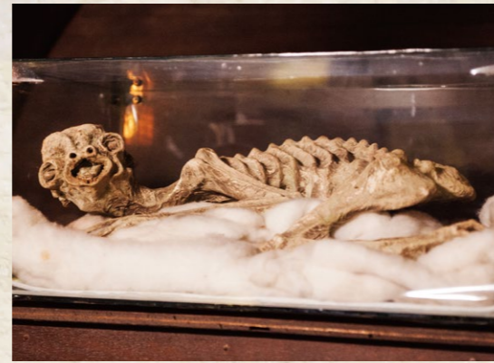
↑ 河童 松浦一酒造株式会社蔵

龍宮寺(福岡市博多区)に伝わる人魚の掛け軸。伝承によると貞応元(1222)年、博多湾に打ち上げられ、龍宮寺(当時は浮御堂と呼ばれる)に葬られた。かつては縁日の日に同寺に安置されている「人魚の骨」を浸けた水を、延命長寿を願う参拝者に飲ませていたという。